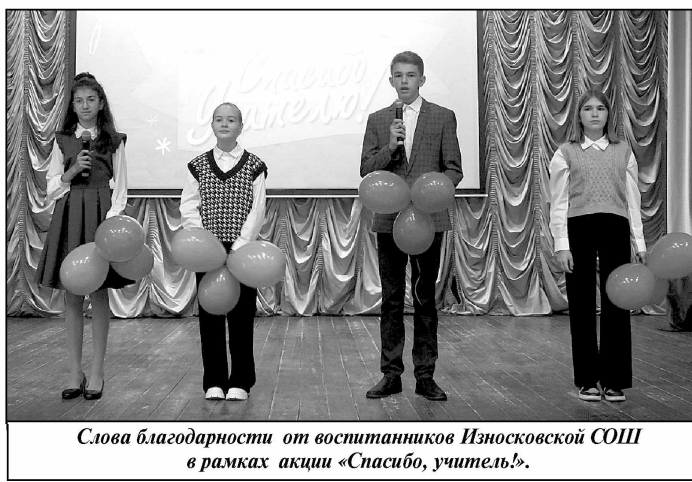
Слова благодарности от воспитанников Износковской СОШ в рамках акции «Спасибо, учитель!».

Руководители района поблагодарили коллективы образовательных учреждений за ту огромную работу, которая была ими проделана в минувшем году по благоустройству и ремонту школ.