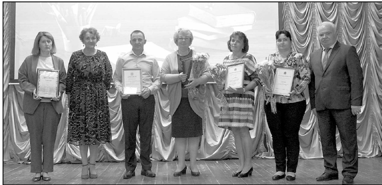
Педагогические работники, удостоенные благодарности от губернатора Калужской области, и представители учебных заведений – победителей Всероссийских и региональных конкурсов.