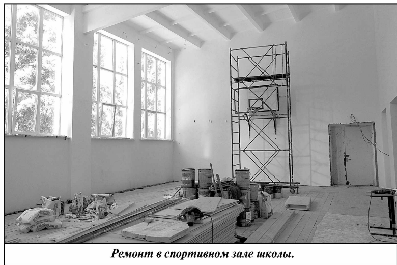
Ремонт в спортивном зале школы.