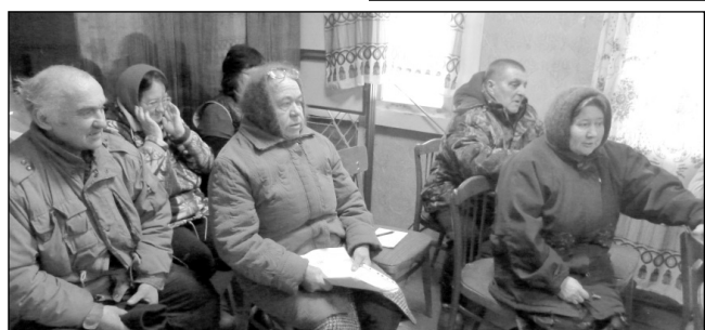
Местные жители СП «Деревня Ореховня».

и как понять, какая земельная площадь домовладения входит в площадь для полива, а какая нет. Также обсуждался и такой, на мой взгляд, немаловажный вопрос: почему при начислении оплаты за водоснабжение приравниваются курица и корова, т.е. объем использованной на них воды начисляется одинаково. Много вопросов касалось и имеющихся на ру-