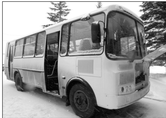
Новый пассажирский автобус ПАЗ.

очень большие деньги, на которые уже приобретена и получена новая техника. Так, на выделенные средства был уже в конце прошлого года приобретен автобус ПАЗ, автобус КАВЗ, два автогрейдера, два экскаватора-погрузчика, автовышка на базе автомобиля ГАЗ. В начале этого года в район еще поступили две комбинированные дорожные машины (КДМ), пассажирский автобус «Газель», пассажирский автобус «Мерседес», самосвал КамАЗ, автокран.