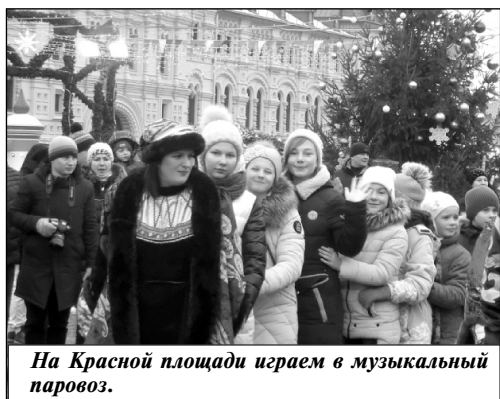
На Красной площади играем в музыкальный паровоз.

Москва, основанная в 1147 году князем Юрием Долгоруким, восхищает своим великолепием. Храм Христа