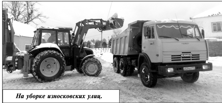
На уборке износковских улиц.