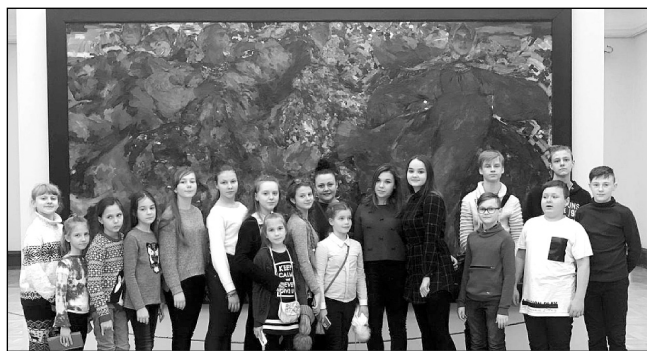
У картины художника Ф. Малявина «Вихрь».