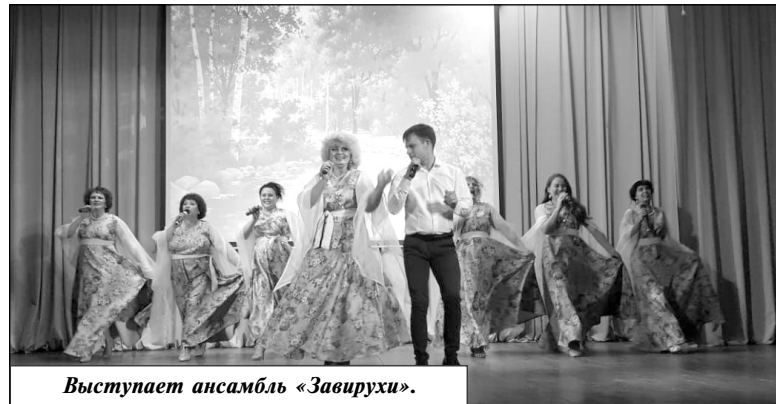
Выступает ансамбль «Завирухи».