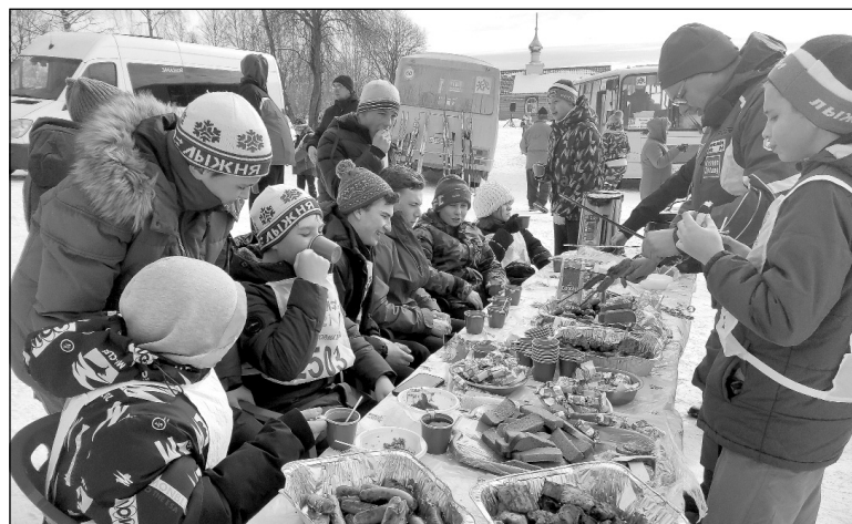
После лыжного забега взрослых и детей ждал настоящий полевой обед с вкусной солдатской гречневой кашей, а также чай, различные сладости и угощения.