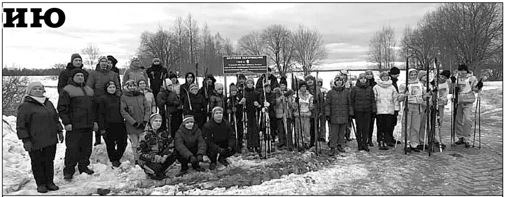
Направление – ПАМЯТЬ... Торжественное открытие дорожного указателя.