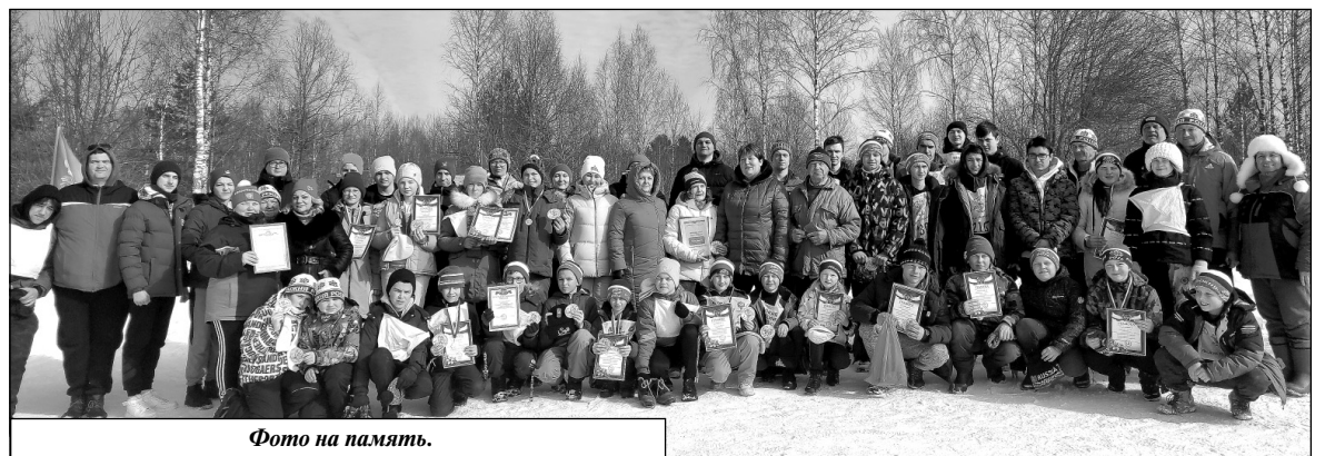
Фото на память.

Также в этот день от администрации района за организацию, проведение и участие в патриотическом мероприятии «Помнит