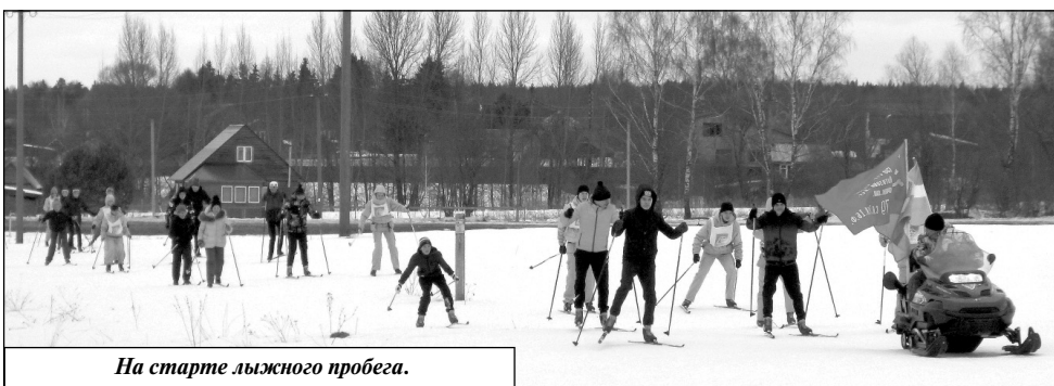
На старте лыжного пробега.