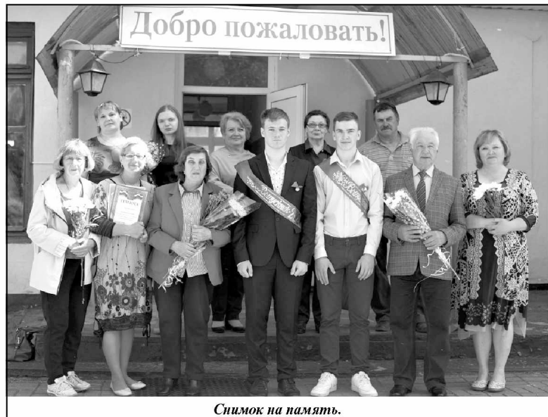
Снимок на память.

никам успешной сдачи экзаменов и поздравил присутствующих с праздником. Он наградил грамотами учащихся, отличившихся в учебной,