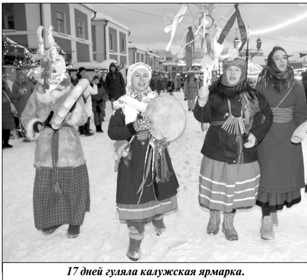
17 дней гуляла калужская ярмарка.

«Ярмарка дала возможность заработать, сделать дополнительную рекламу бизнесу и оценить, как работает наша команда. Выездная торговля – это мобильность, оперативность и готовность к любым обстоятельствам. Благодаря участию в мероприятии появилась уверенность, что мы можем развивать бизнес, открывать новые точки продаж», – рассказал руко-