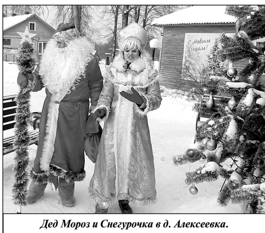
Дед Мороз и Снегурочка в д. Алексеевка.

Новогодняя ночь запомнилась всем без исключения своим весельем и яркой радостью от предвкушения чего-то нового, сказочного.