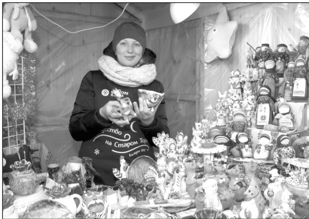
Самозанятые представили калужанам авторские изделия.

На площадке прошли тематические выставки и фестивали: ярмарка фермерских продуктов, выставка-продажа продук-