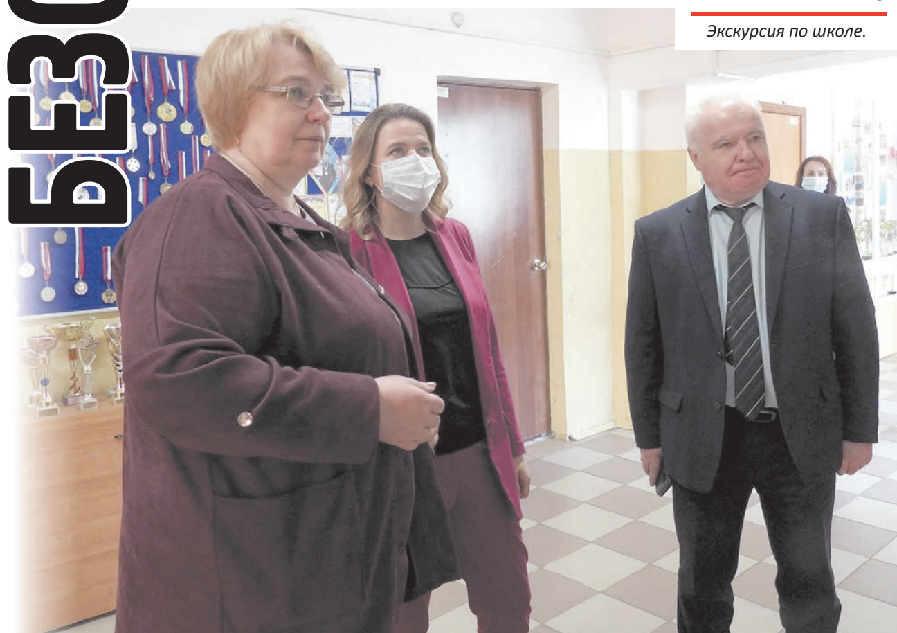
Экскурсия по школе.