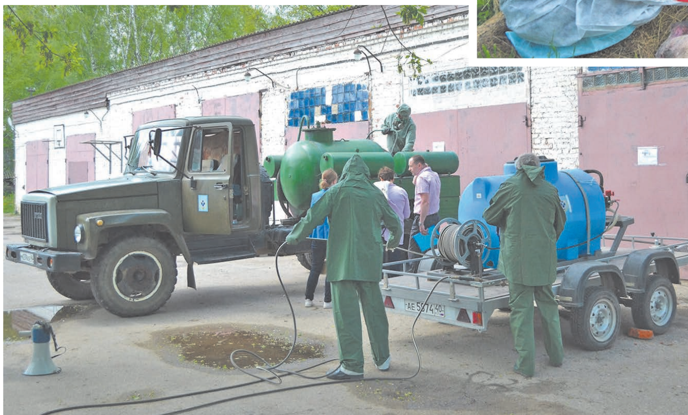
Подготовка к дезинфекции сельхозпомещений.