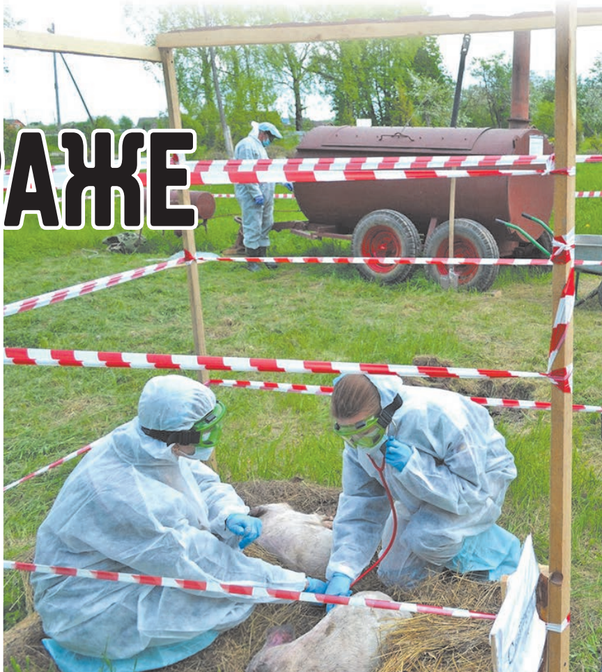
Диагностика АЧС в полевых условиях.

Конец мая для специалистов госветслужбы был ознаменован выездными учениями в несколько районов области, где айболиты показали свою готовность по выявлению возбудителей особо опасных болезней животных, их предупреждению, схемам взаимодействия с местными органами власти и оповещению сельского населения.