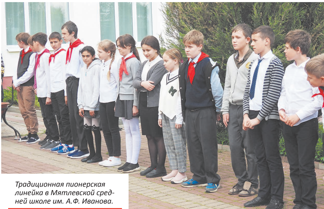
Традиционная пионерская линейка в Мятлевской средней школе им. А.Ф. Иванова.